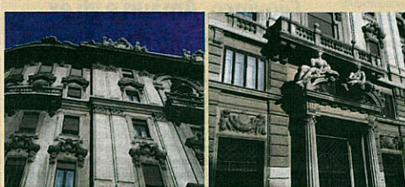
Mq. 400 + Box doppio

Ufficio in Vendita Piazza Duse - C.so Venezia