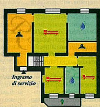
Pianta Piano Terzo

Ufficio in Vendita Piazza Duse - C.so Venezia